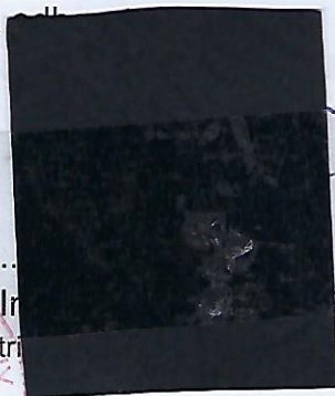
Doc. Ir. [redacted]